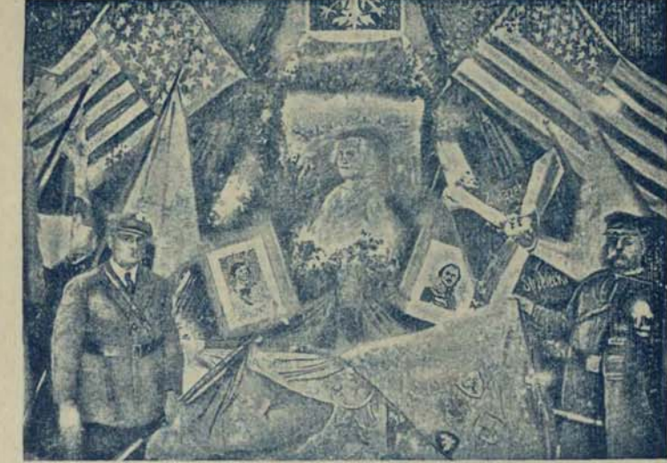
W Katowicach uczczono 150 rocznicę niepodległości Stanów Zjednoczonych dn. 3 lipca br. wroczyście Akademiję w teatrze miejskim. Ilustracja przedstawia żywy obraz na scenie, przedstawiający na tle sztandarów amerykańskich i polskich oraz portretów Washingtona, Kościuszki i Pulaskiego, Powstańców i Sokola śląskiego za sztandarami zwyciężczy. Szanदार Powstańców Śl., uświetniony na ilustracji, jest darem Obrońców Luwowa i na drzewcu w formie gwiazdy znajdują się odznaki wszystkich odziałów walk o Luwo.