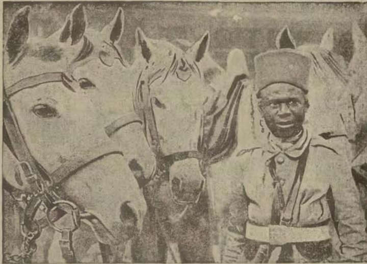
Jak już donosiliśmy, do Paryża na uroczystość święta narodowego przybył sultan Maroka, który też miał być obecny na otwarciu moszki mahometańskiej. Nasza rytmna przedstawia Berbera i gwardji sultańskiej, w otoczeniu wierzchowców.

Dr FR. HELIŃSKI z Wiednia ordynuje w Clechocinku dworek Gębzyńskich (nad główną pocztą). Choroby przemiany materji. — Zastryki i szczepienie przeciw artretyzmowi — nerwobólom i otyłości. 367 k