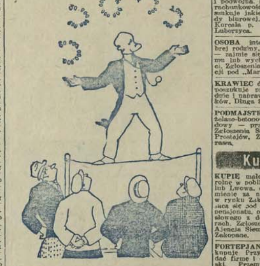
Podatnicy francuscy, na widok konglerskich sztuczek ministra Caillaux: Bravo! Tyłko to skoczy się znów na tem, że nam to wszystko spadnie na głowę!