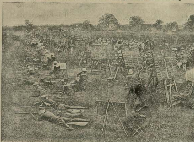
W Bielej, w Anglii, testuje Towarzystwo strzeleckie, które prowadzi szkołę strzelania. Raz do roku odbywa się publiczny egzamin uczniów tej szkoły. Zdjęcie nasze daje pojęcie, jak się taki egzamin odbywa. Na placu rozstawione są tablice, na których uczniowie notują celne strzały uczniów, otrzymujących następnie świadectwa.