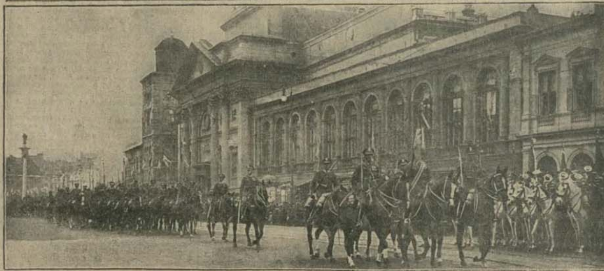
Kulminacyjnym punktem uroczystości 3-majowych w Warszawie była deflada przed Prezydentem Rzeczypospolitej, członkami rządu i korpusem dyplomatycznym. Fotografje nasze przedstawiają ogólny widok trybuny w czasie deflady, oraz defladę 1 p. szwoleżerów.