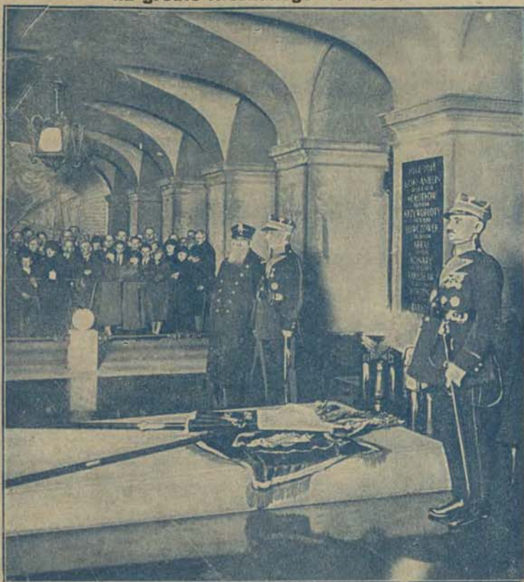
W nocy z dnia 2 na 3 maja o godz. 12, dwa pokolenia powstańców: weterani 63 roku i górnośląscy powstańcy, złożyli swe sztandary na grobie Nieznanego Żołnierza w Warszawie. Stało się to z racji 5-lecia wybuchu powstania górnośląskiego, które zadecydowało ostatecznie o przynależności przetrwanej ziemi Piastowskiej do macierzy. Złote