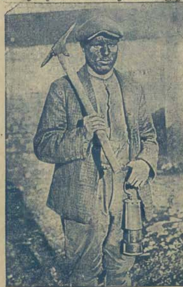
Typ górnik angielskiego.