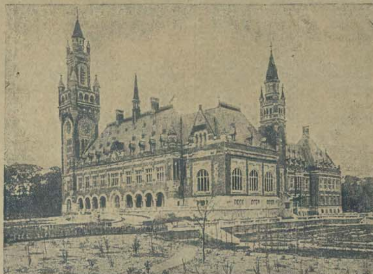
Międzynarodowy trybunał rozjemczy w Radze, którego gmach przedstawiony jest na naszej ry- cinie, obchodzi w roku bieżącym 25-lecie swego istnienia.

RUTYNOWANA starsza go- spodyni-kucharka, obma- niata z bodowia drobiu i cierliwym — potrzeba zaraz. Tyko świadczyć z długotrwałego pobytu w je- dnym mieście mogą być u- ważane. Odpisy świad- ectw, których się nie zwraca, nadsyłać do Administracji Kurjera pod „Gospodyni- kucharka” — 9053