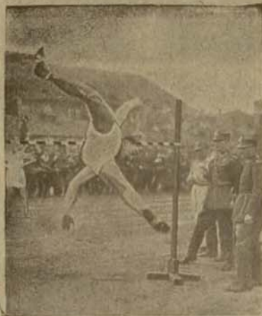
(Tł.). W czasie zawodów wewnętrznych Centr. wojsk. szkoły gimnastyki i sportów w Poznaniu, osiągnięto szereg bardzo dobrych wyników, m. in. w skoku wzwyż. Zdjęcie nasze przedstawia p. Korolkiewicza (Polonia) w oryginalnej pozycji po udanym skoku.