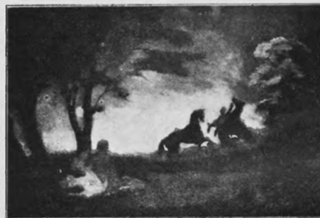
STANISŁAW RZECKI Przygoda