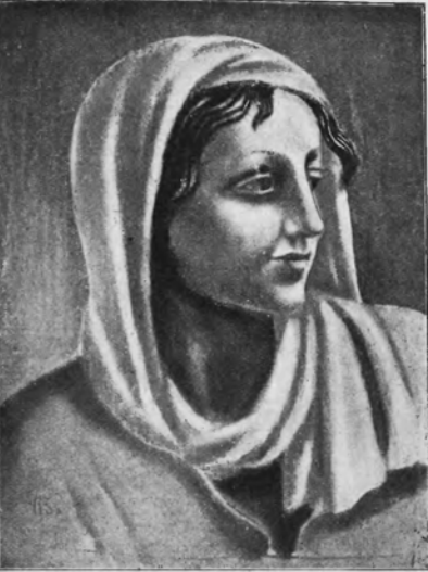
WACŁAW BORÓWSKI Głowa dziewczyny