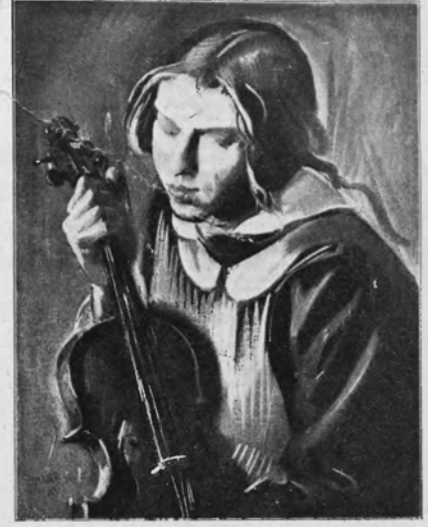
TADEUSZ PRUSZKOWSKI Dziewczyna ze skrypcami