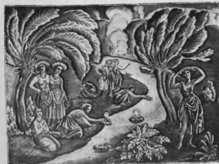
WŁADYSŁAW SKOCZYŁAS Wianki