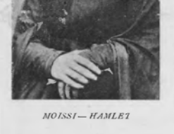
MOISSI — HAMLET