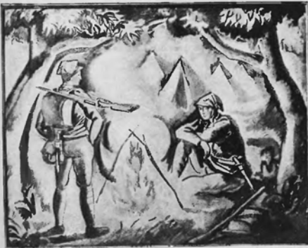
WŁADYSŁAW ROGUSKI Przy ognisku