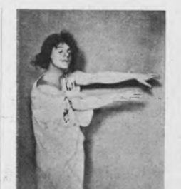
MOISSI — EDPY