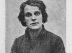
MOISSI — EDPY

Nawiązawszy z Zachodem stosunki polityczne i gospodarcze, rząd sowiecki szuka intensywnie kulturalnego z nim kontaktu. Nie mówiąc o długotrwałej — na obu półkulach — podróży trupy Stanisławskiego, — ostatnie tournée artystyczne głośnego Teatru Kameralnego Tairowa oraz Wystopy poszczególnych artystów daly Europie miarę współpracownictwa sztuki rosyjskiej, stanowiąc najlepszą w tym kierunku metodę propagandy.