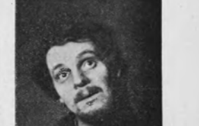
MOISSI — PROTASOW

swego pobytu, zapoznając się z nowymi prądami w sztuce rosyjskiej. Gością artystyczną Moissiego w Moskwie i w Petersburgu trwała dwa tygodnie wystawa w tym czasie w „Hancie”, „Kroju Edypt”, „Upiorach” oraz w repertuarze tolstojowskim: „Żywym trupie” i w jednej z komedji. Te zwłaszcza role obudziły szczególne zainteresowanie. Pośród ogromnego powodzenia, jakim cieszyły się występy trupa niemieckiego, krytyka podkreśla w jego grze, obok świetnej męskiej aktorskiej, pierwsi nawiąski ludzkie, miękki liryzm oraz niesłychaną lekkość wykonania — to wszystko, czem tak czaruje artysta Zachodu, Moissi.