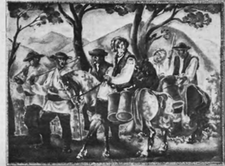
WACŁAW WĄSOWICZ Huculi w drodze