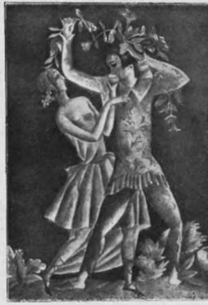
IRENA POKRZYWNICKA Wino