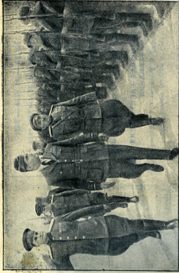
2 Уполномоченный Верховного Главнокомандующего экспедиционными силами союзников главный маршал авиации Теддер обходит фронт почётного караула.