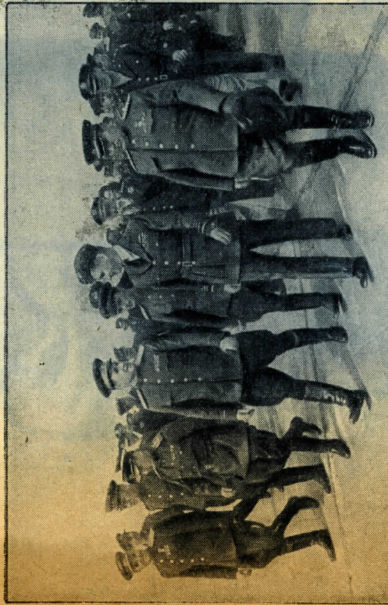
3 Главный маршал авиации Теддер (второй справа), генерал армии Соколовский (четвёртый справа), комендант Берлина генерал-полковник Берзарин (первый справа) покидают аэродром.