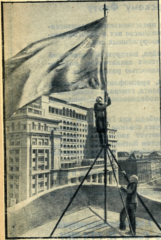
Да здравствует Праздник Победы! 9 мая, 5 часов утра. Красные флаги взвились над Москвой.