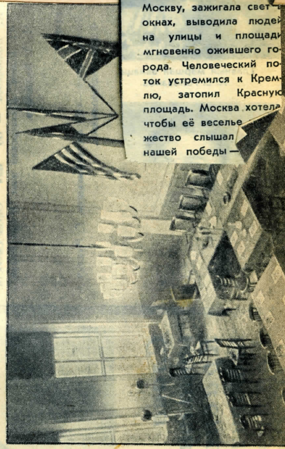
6 Зал ещё пуст. Через несколько минут сюда направляются представи-...тели победивших союзных держав и будут вызваны представители

Весть о победе будит Москву, зажигала свет в окнах, выводила людей на улицы и площади мгновенно ожившего города. Человеческий поток устремился к Кремлю, затопил Красную площадь. Москва хотела чтобы её веселье жество слышал нашей победы —