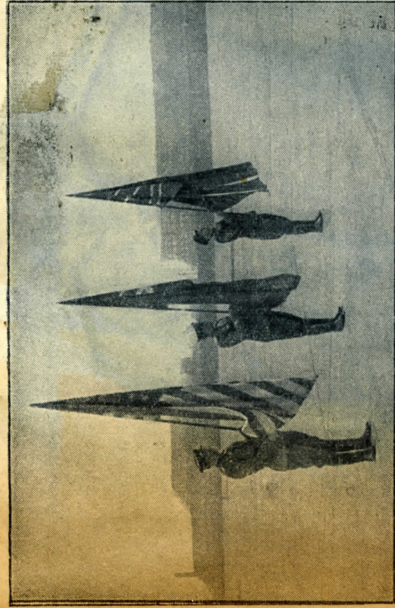
1 Темпельгофский аэродром в Берлине 8 мая 1945 года. Офицеры Красной Армии с государственными флагами СССР, США и Великобритании.