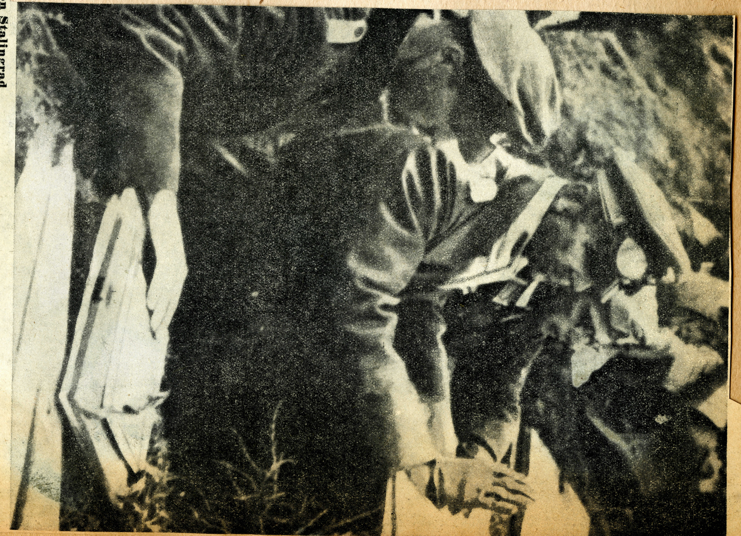
General Paulus, der Oberkommandierende der bei Stalingrad eingeschlossenen deutschen Truppen, die trotz aussichtsloser Lage wochenlang ihren Widerstand fortgesetzt haben