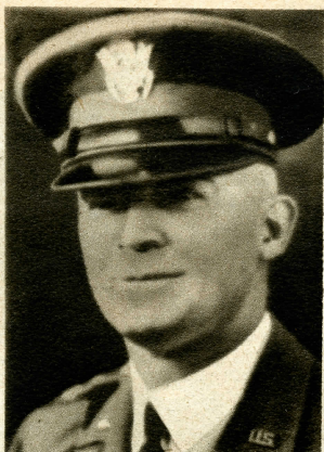
Generalleutnant H. Arnold Seit dem denkwürdigen Angriff auf Pearl Harbour wurde in den Vereinigten Staaten der Luftwaffe erhöhte Aufmerksamkeit geschenkt. Ihr Oberkommandierender ist Generalleutnant Henry H. Arnold, «der erste Flieger der Armee». Schon vor mehr als 30 Jahren versuchte er auf alle möglichen Arten in der Luft herumzugondeln und sammelte in all diesen Jahren genügend Erfahrungen, um den Ausbau der Luftflotte tatkräftig an die Hand zu nehmen.