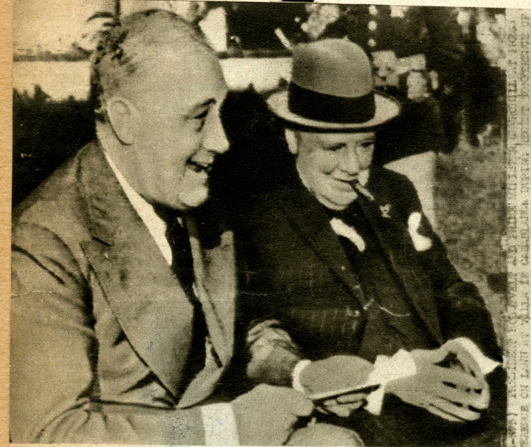
Die beiden Staatsmänner während der Besprechung im «Weissen Haus» in Casablanca. (Radiobildtelegramm)