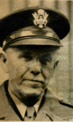
General G. C. Marshall wurde wegen seiner aussergewöhnlichen strategischen und organisatorischen Fähigkeiten über die Köpfe zahlreicher dienstälterer Militärs hinweg zum Generalstabschef ernannt. Schon im Weltkrieg zeichnete er sich durch planvolle, klardurchdachte Unternehmungen aus. Er steht im 61. Lebensjahr.