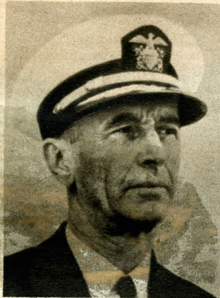
Ernest Joseph King, Eine der glanzvollsten militärischen Karrieren machte zweifellos der Sohn eines amerikanischen Eisenbahn-Mechanikers, Ernest Joseph King, der als Chefkommandant der amerikanischen Flotte nach Casablanca kam. Sein Leben ist turbulent, und die wildesten Geschichten über seinen Mut und seine Tollkühnheit zirkulieren bei seinen Kameraden. Er sei todsicher immer dabei, wenn irgendwo etwas los sei.