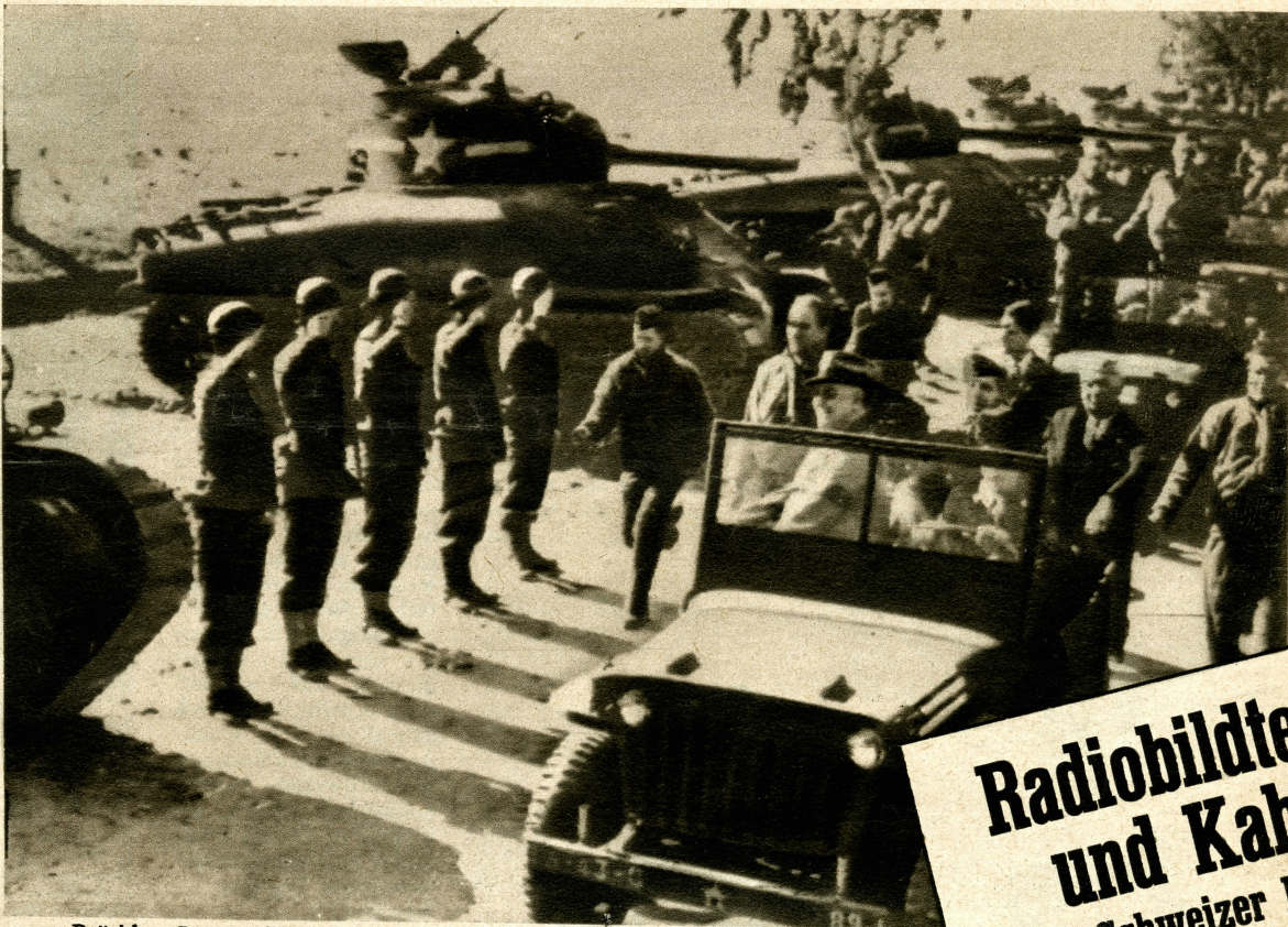
Präsident Roosevelt (im Vordersitz des Autos stehend) bei der Inspektion amerikanischer Truppen in Nordafrika.

Radiobildtele und Kabel der «Schweizer Illu Von der Zensur