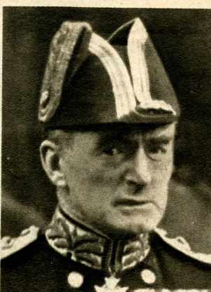
Sir Dudley Pound war bei Ausbruch des Krieges Oberkommandierender der britischen Mittelmeerflotte. Er steht im 66. Lebensjahr. Während des Weltkrieges zeichnete er sich als Kommandeur eines Schlachtgeschwaders in der Seeschlacht von Jütland aus. Er trägt höchste französische und japanische Auszeichnungen. Im Jahre 1922 wurde er in die Admiralität berufen. Von Churchill auf die Stelle des Ersten Seelords berufen, ist er der engste Berater des Premiers in allen Fragen der Seestrategie.