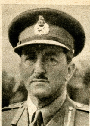
Sir Allan Brooke ist als Chef des Reichsgeneralstabes für die Führung und Koordinierung aller Streitkräfte des britischen Empires verantwortlich. Er steht im 60. Lebensjahr und war im Weltkrieg als Truppenkommandeur in Frankreich. 1936 übernahm er im Kriegsministerium den Posten des Chefs der Ausbildungsdienste der Armee.