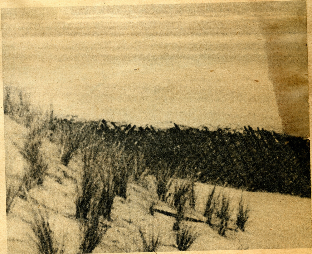
Die ganze Küste des europäischen Festlandes entlang zieht sich durch die Dünen in vielen Linien dieser Wald aus Stacheldrahtverhau. Deutsche Soldaten stehen hier auf Vorposten gegen Landungsversuche. Jedem frisch eintreffenden Truppenverband wird eine neue Stellung angewiesen

Zeichnung: Mehl