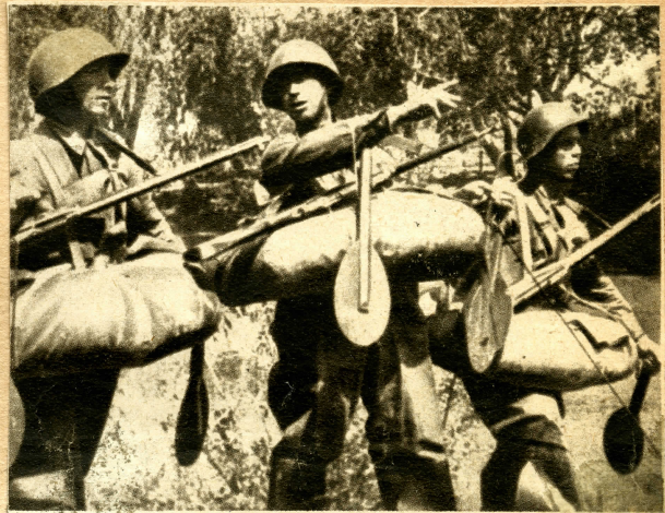
Mit Schwimmgürtel und Paddeln ausgerüstete russische Sappeure auf Patrouille.

Hogy Európát megmentsük — fejezi be a Das Schwarze Korps a cikket — meg kell semmisítenünk a bolsevizmust és ebben a törckvű-sünkben nem végezhetünk félmunkát és nem köthetünk kompromisszumot.