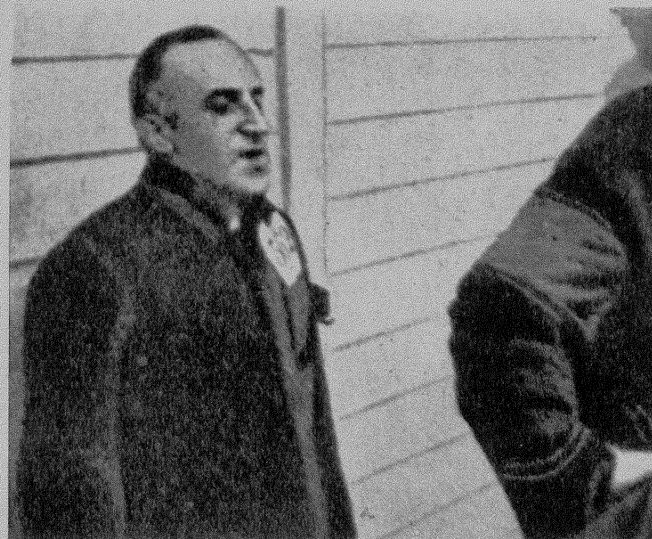
Interrogatoire de l'écrivain allemand Karl Ossietzki. Interné et assassiné par les nazis, il devait obtenir le Prix Nobel pendant sa détention.