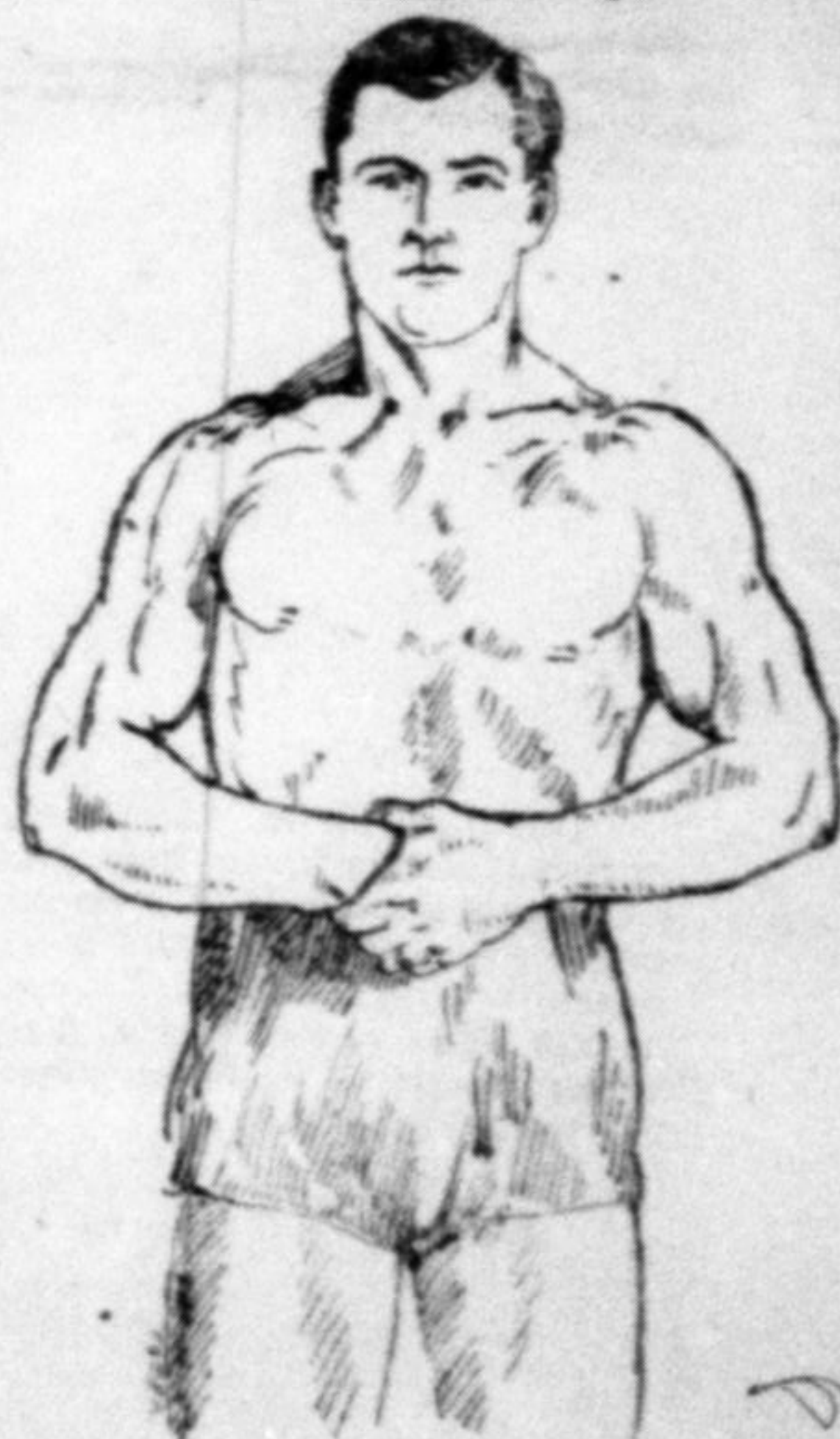
Гляди стор. 5.

В імени Річнопольської Польської! Суд окружний карний, яко Трибунал пресовий у Львові, рішив на внесок державної прокураторії, що зміст часописи „Новий Час“ число 61 (78) з дня 14. серпня 1924 в артикулах під заголовком: 1) „Докрути університетської геши“ в уступах від слів: До цього часу ми... до кінця артикулу 2) „Діяльність Українсько-литовсько-білоруського Комітету в Парижі“ в уступах від слів: Цей Комітет видав... до кінця 3) „Огіркове время“ в уступах від слів: Але край наш до кінця, 4) „Хруніада в Яворівщині“ в цілости, 5) „З Краю“ а) титул першої нотатки б) з нотатки четвертої уступ від слів: Хотіли через Чехами до кінця нотатки, містить ество а) злочину з §§ 65-а, 98-б і провини з § 298 з. к. ад