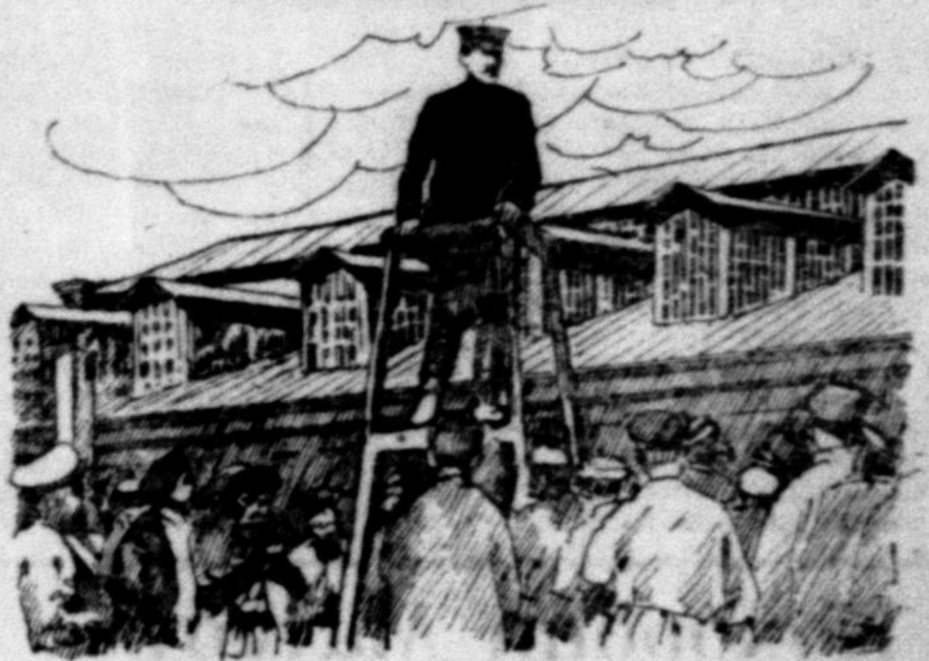
Бачимо тут, як голова большевицької Росії Калєнін промовляє в місті Тулі на вічу — до робітників залізничної фабрики.