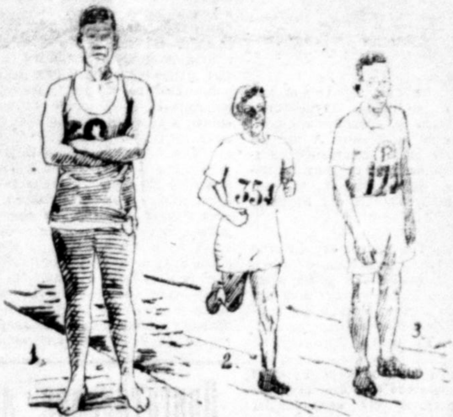
Наша ілюстрація представляє першого, другого і третього побідника в марафонському бігу. Перший, а про те найславніший з них, це 40-літній Фінляндець, другий Італієць третій Американець. Ширше про них і про марафонський біг (Олімпіяду) дивись стаття на стор. 4 і 5.