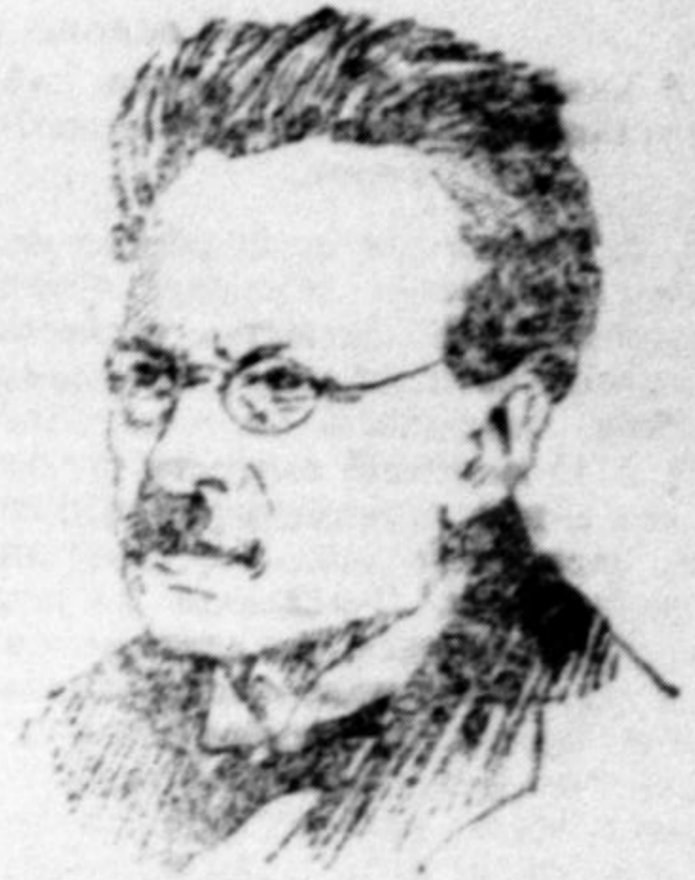
Рисунок представляє славного англійського винахідника „смертельних“, або „дьявольських“ лучів Матю. Ці винайдені ним лучи малиб бути в найблищій війні найуспішнішим орудником знищення. Але хто чим воює — той від того гине. Таке і з цим винахідником. При своїх лабораторійних працях ушкодив собі око, а при операції стратив його зовсім.

Микола здригнувся і ідовито подивився на Панька, що випередив його в розмзві.